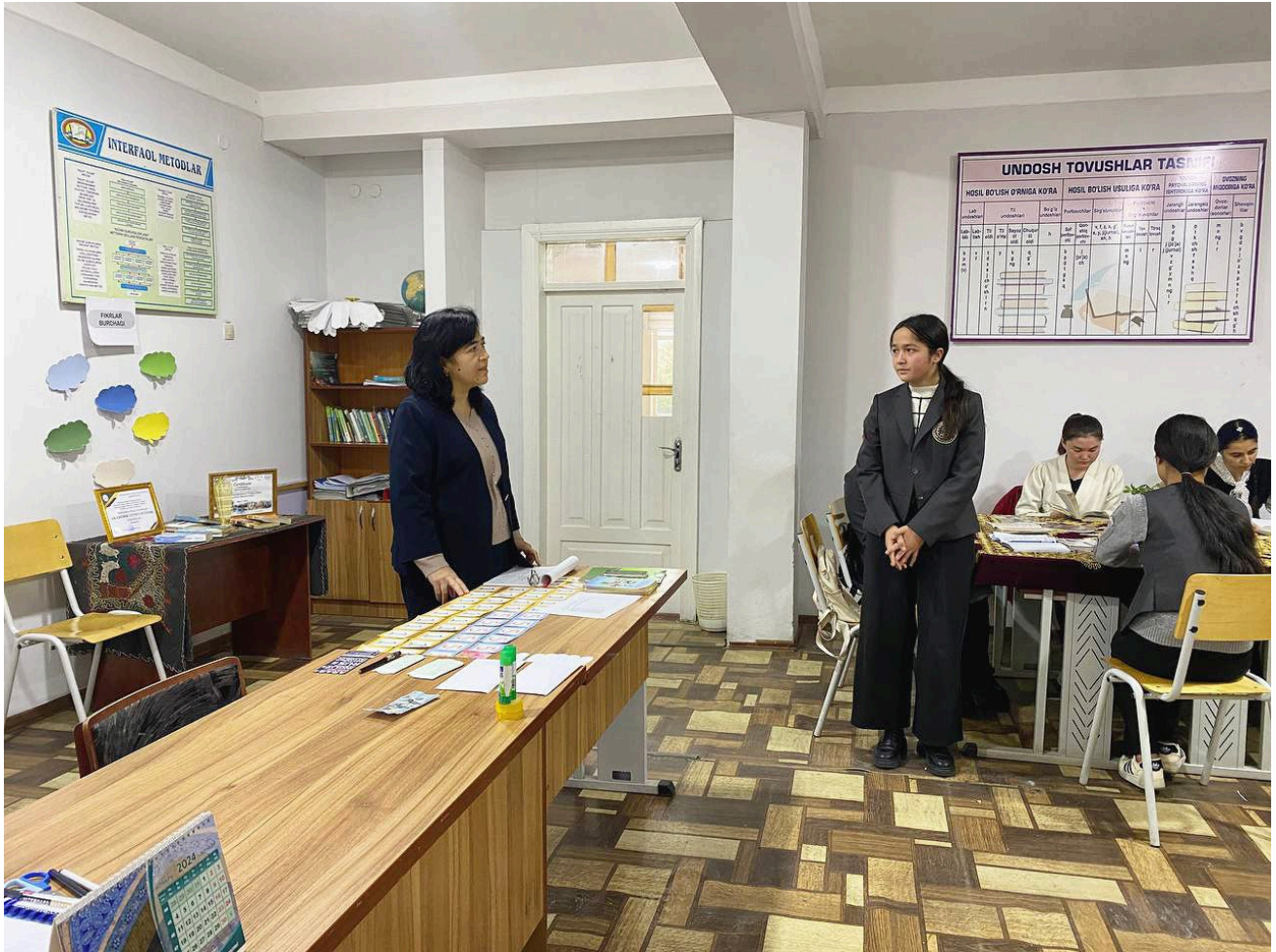
SamDChTI akademik litseyi axborot xizmati